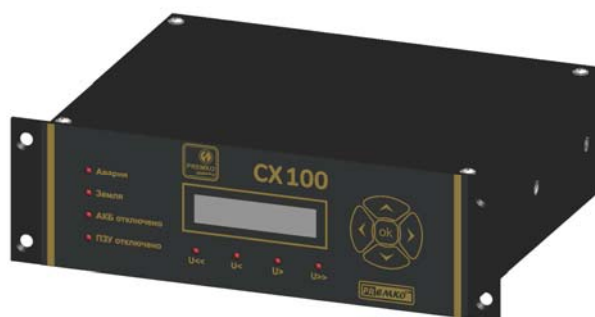
Рис. 4 Внешний вид контроллера PREMKO™ CX100.

Контроллер имеет ЖКИ дисплей, который отображает его текущее состояние. В случае выхода за пределы нормы контролируемых параметров или поступления команд на дискретные входы, информация о текущем событии индицируется на дисплее. Внешний вид контроллера с кнопками управления приведен на рис. 4.