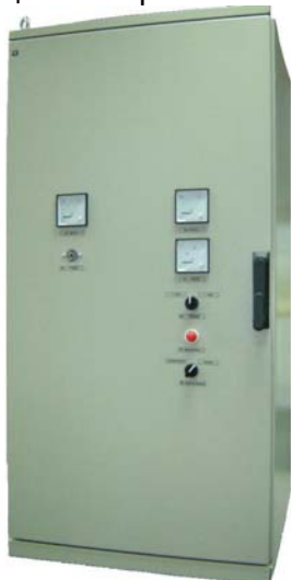
Рисунок1. Внешний вид шкафа SOT 01 – 03

4.2 Шкаф заряда представляет собой металлическую конструкцию шкафного типа одностороннего обслуживания с габаритными размерами 1200(2200)х600х600. Высота шкафа зависит от количества установленных в нем выпрямительных модулей. На дверях шкафа расположены вольтметр контроля напряжения на шинах постоянного тока, амперметр контроля нагрузки, схема управления обогревом, а также указательное реле сигнализации «Авария в шкафу».